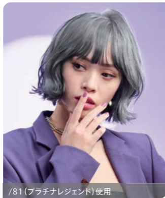
/81 (プラチナレジェンド) 使用