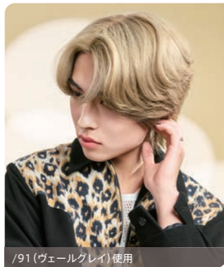
/91 (ヴェールグレー) 使用