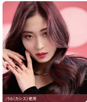
/56 (カシス) 使用

本場韓国のトレンドをふんだんに盛り込んだ「最新韓国カラーコレクション」 日韓の韓国ヘアのスペシャリストとコレストンのコラボレーションでお届けします。