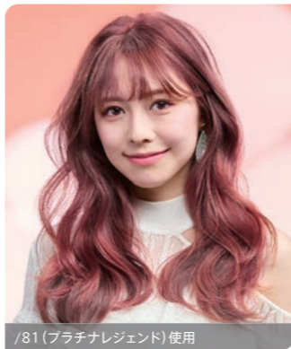
/81 (プラチナレジェンド) 使用